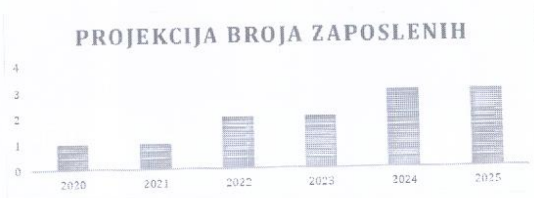
Grafički prikaz: Plan kretanja broja zaposlenih po godinama

Planirano kretanje broja zaposlenih prikazano je grafičkim prikazom u nastavku, a odnosi se na period od 2020. g. - 2025. g. Grafički prikaz prikazuje povećanje broja zaposlenih u odnosu na prethodne godine (prosječan broj zaposlenih) što je rezultat restrukturiranja tvrtke i povećanja prodaje do kojeg je došlo kroz projekciju budućeg poslovanja tvrtke.